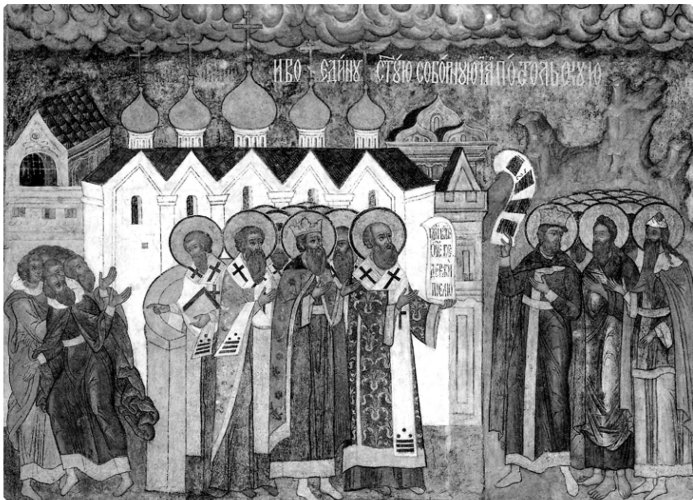
Фрагмент росписи западной стены Архангельского собора Московского Кремля «Символ веры: „И во едину Святую, Соборную и Апостольскую Церковь...”» XVII в.

В этом выпуске рубрики «Символ веры», адресованной новоначальным православным христианам, завершается публикация труда выдающегося русского мыслителя, богослова, историка и писателя Алексея Степановича Хомякова (1804–1860) «Церковь одна» с изложением православного учения о Церкви и церковной жизни.