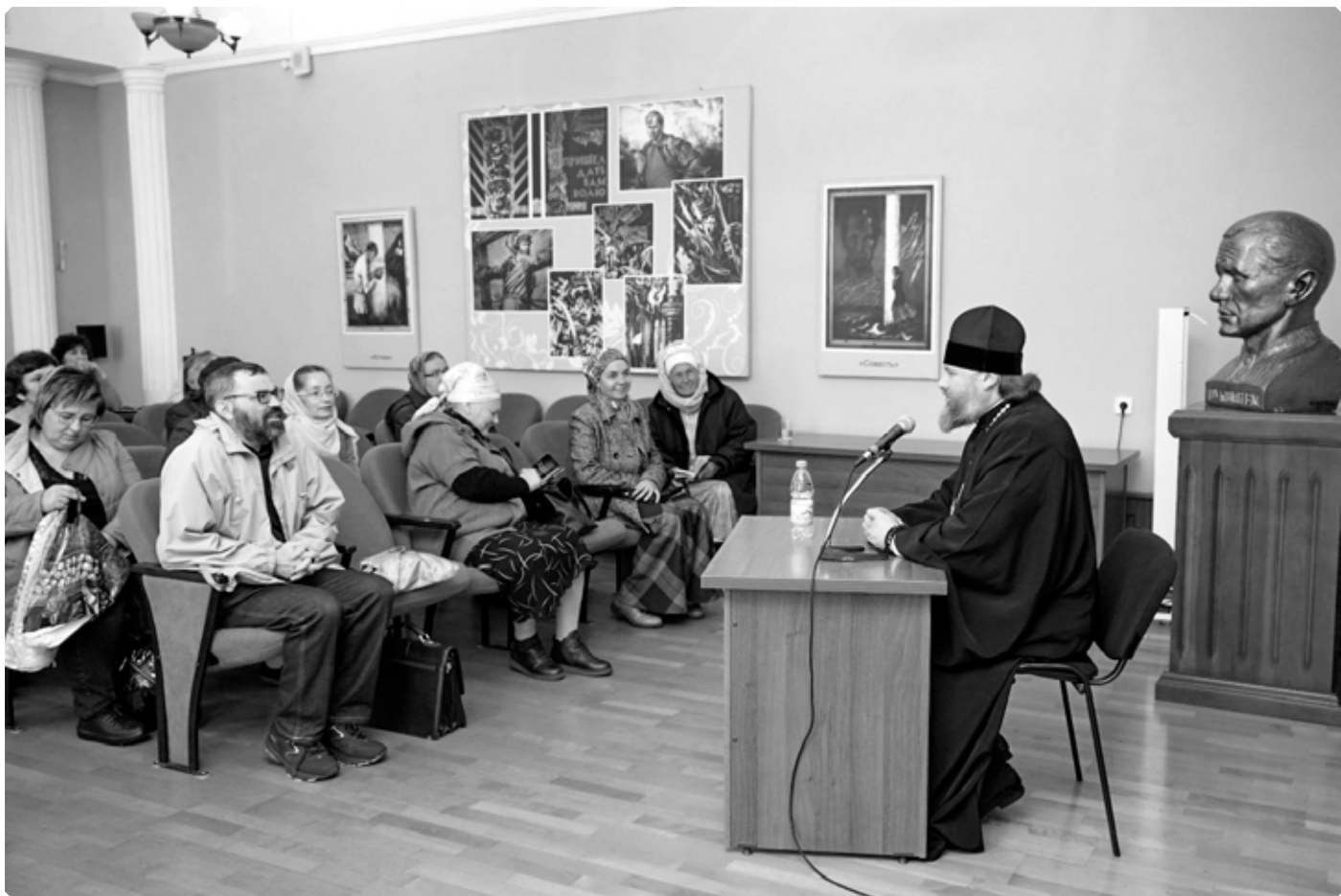
Просветительская встреча «Гора Афон». Центральная городская библиотека имени В.М. Шукшина. 1 октября 2023 г.