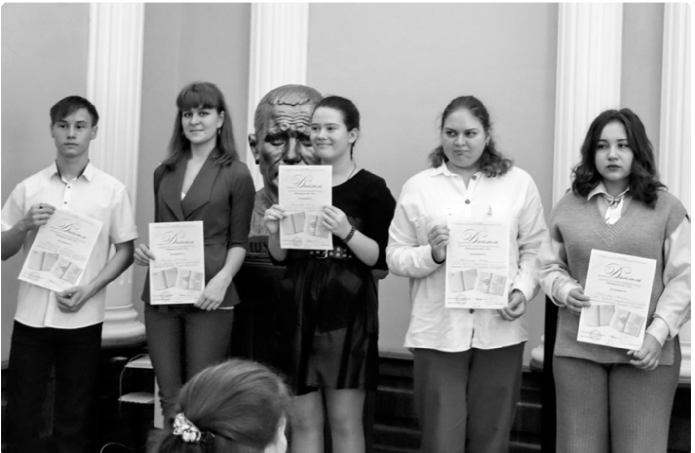
Обладатели дипломов конкурса чтецов «Прекрасен наш союз...» Центральная городская библиотека им. В.М. Шукина. 20 октября 2023 г.