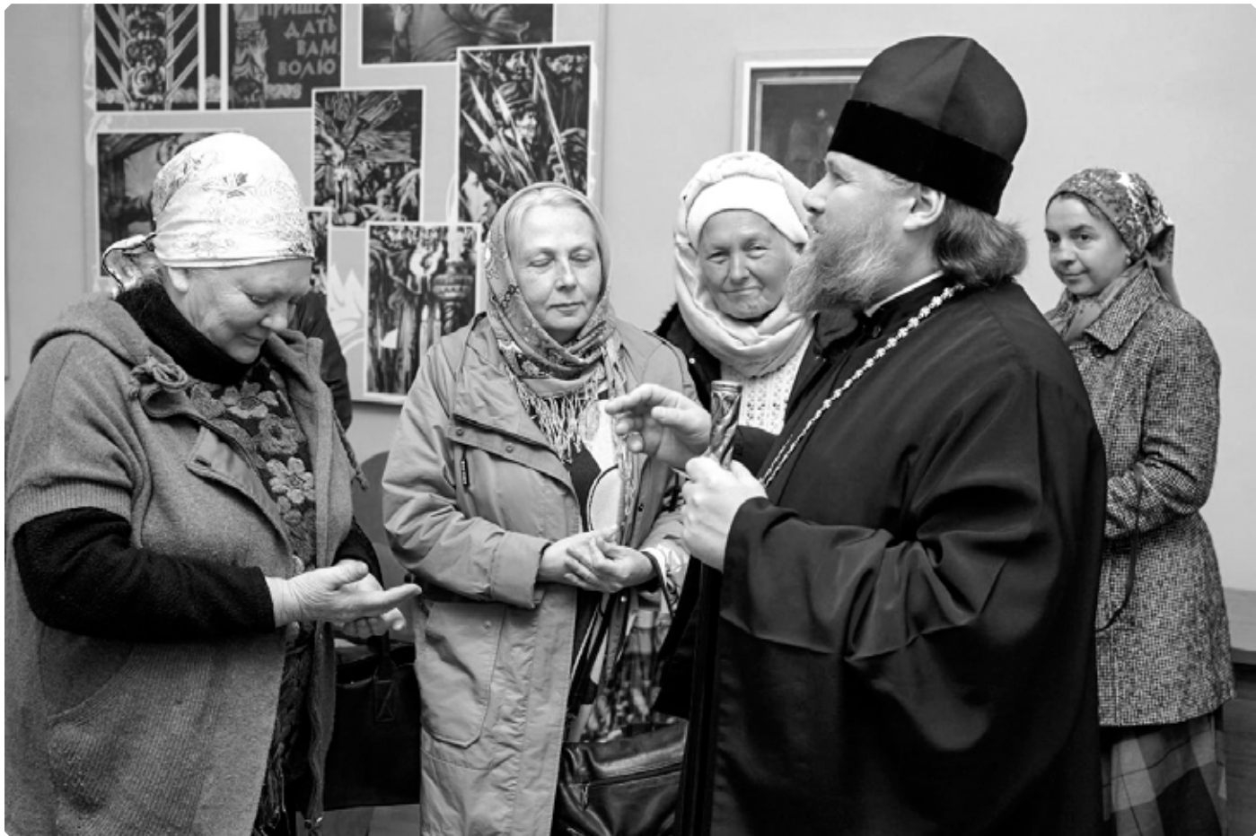
Благословение архиерея. Центральная городская библиотека имени В.М. Шукшина. 1 октября 2023 г.