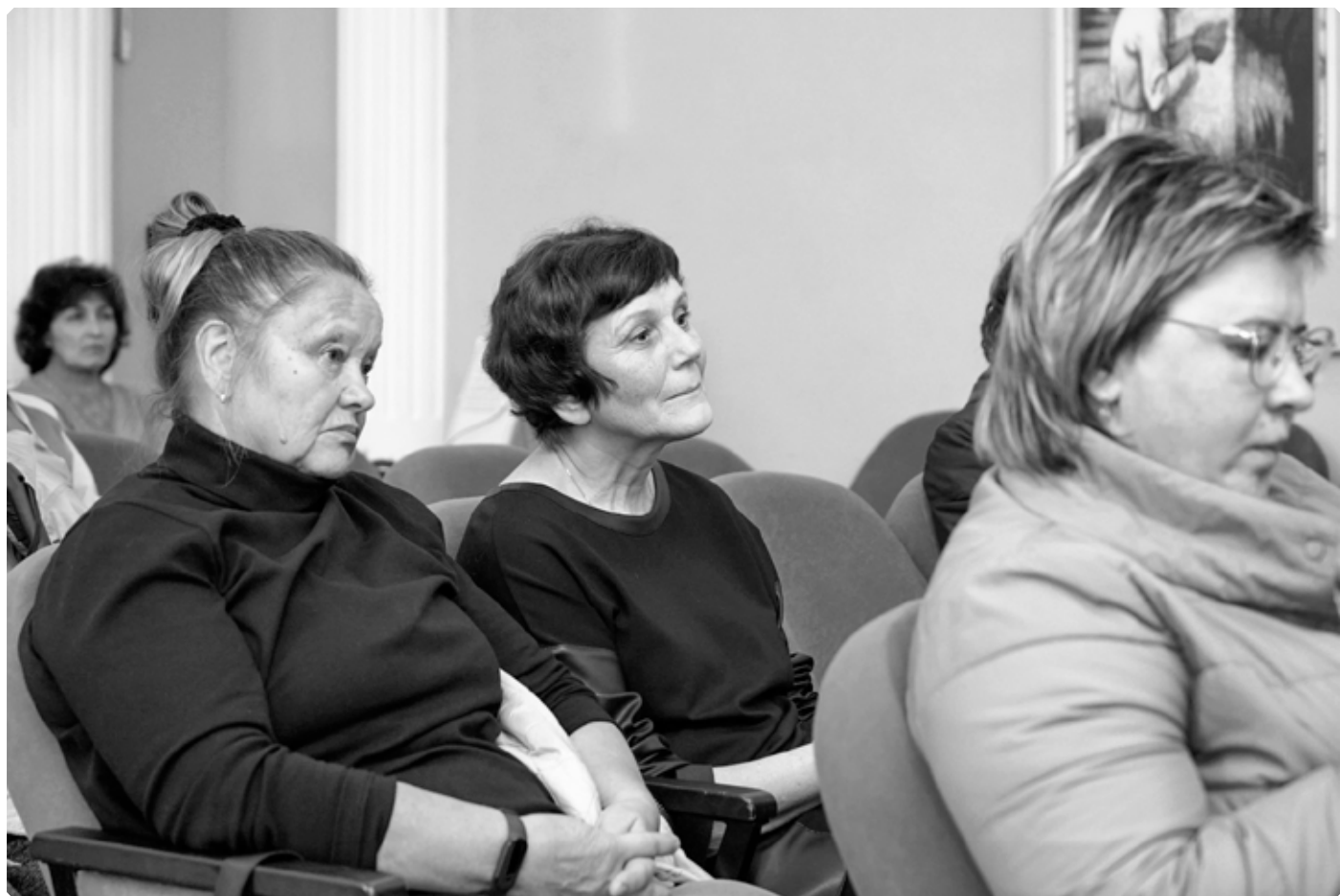
Участники встречи «Гора Афон». Центральная городская библиотека имени В.М. Шукшина. 1 октября 2023 г.

Вскоре я пришел к старцу Паисию с вопросом: