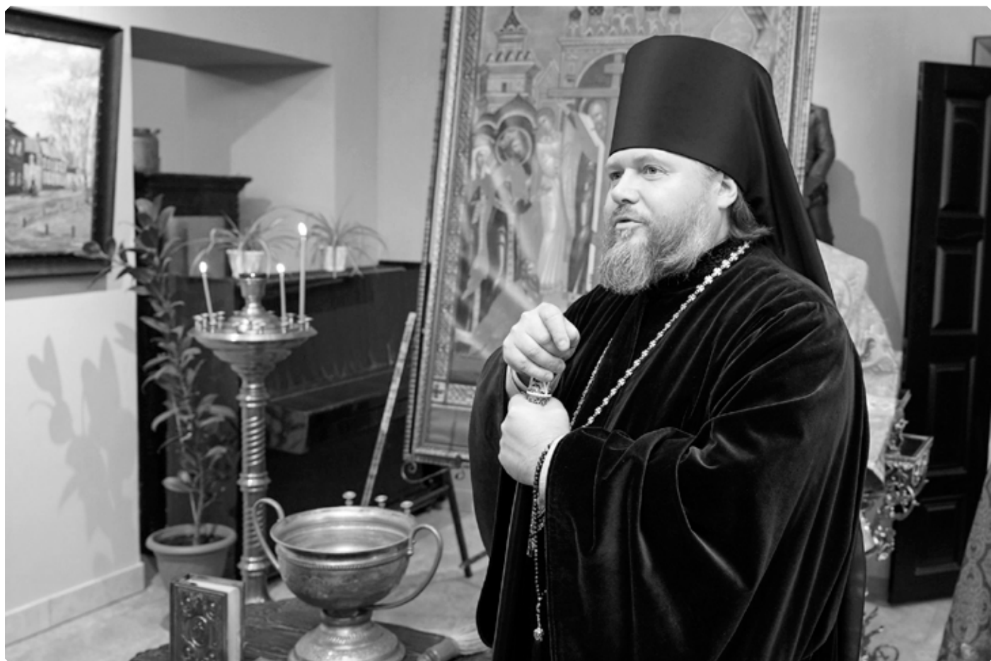
Преподобный Серафим, епископ Бийский и Белокурихинский, на открытии Крестовоздвиженской ярмарки. Бийское архиерейское подворье. 23 сентября 2023 г.

Культурный человек в традиционном понимании – это в первую очередь человек нравственный. Для него естественно уступать престарелому человеку место в автобусе, пропускать вперед женщину, уважать старших, ценить и любить свою историю и культуру, почитать святыни. Некультурный же поступает равно наоборот: весь мир для него – парк развлечений, где он стремится всеми возможными и невозможными способами удовлетворить свои прихоти и желания. Его свобода – это свобода бросить обертку мимо урны, написать на стене непристойное слово, сломать скамейку в парке или наглубить прохожему.