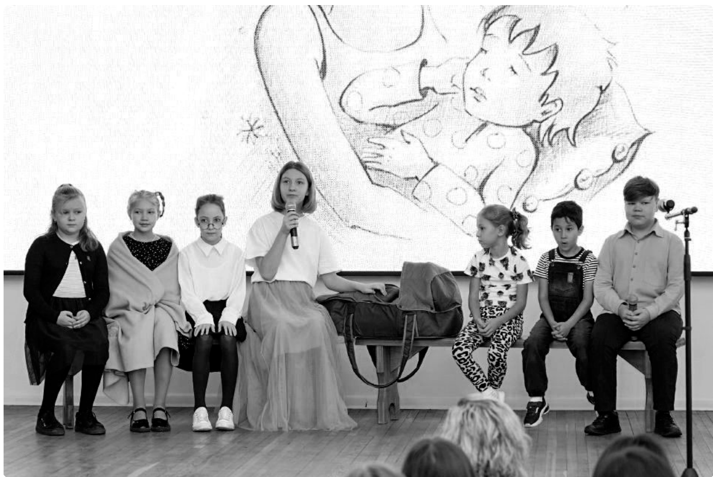
Выступление коллектива детской театральной студии «Веселые ребята» Дома культуры и спорта ФКП «БОЗ». 19 октября 2023 г. АГГПУ имени В.М. Шукишина