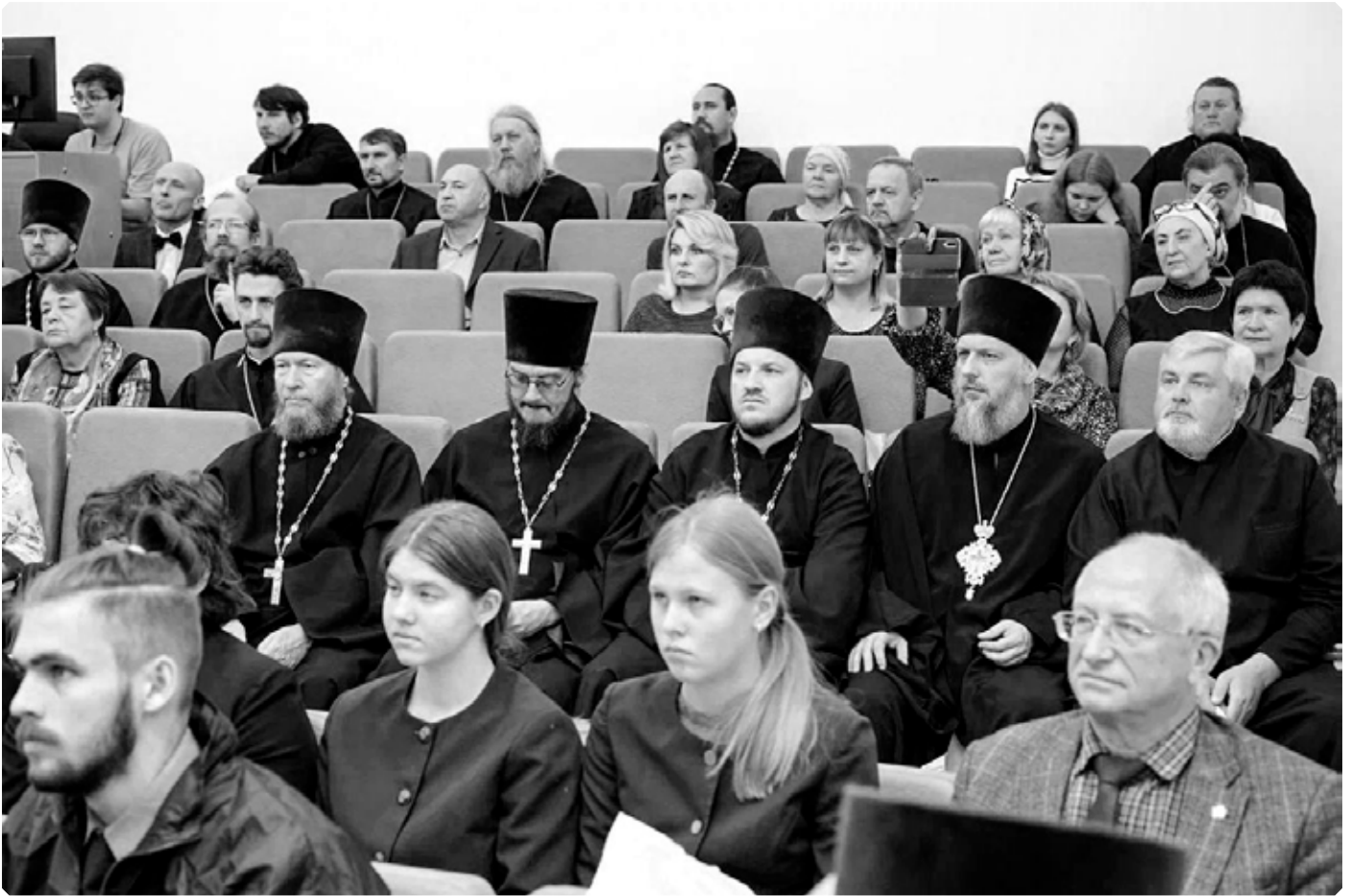
Духовенство и миряне на Пленарном заседании IV Покровских образовательных чтений Бийской епархии. 19 октября 2023 г.

мировоззрение на светской, внецерковной культуре.