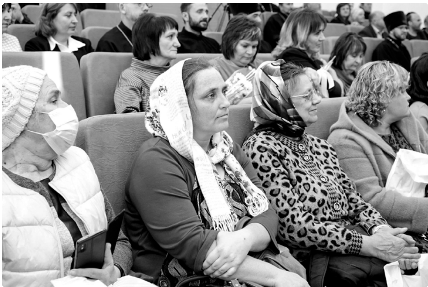
Участницы образовательного форума в Алтайском государственном гуманитарно-педагогическом университете имени В.М. Шукшина. 19 октября 2023 г.

Каков дух народа, такова и его культура. Можно сколько угодно пенять на зеркало, но оно отражает лишь то, что перед ним находится. Можно сколько угодно восторгаться православной культурой и добрыми традициями предков, но если мы сами не станем их носителями, если с помощью Божьей мы не изменим себя покаянием и деятельным благочестием, то мало чем будем отличаться от неверующих носителей светской культуры.