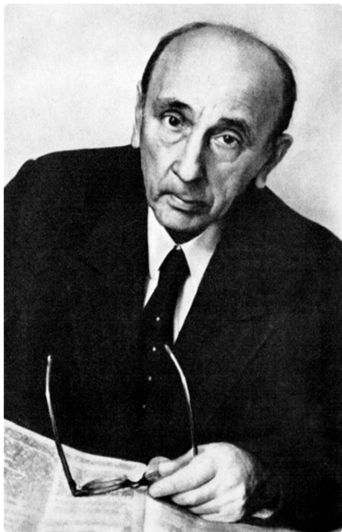
Русский философ, культуролог, литературовед Михаил Михайлович Бахтин (17.11.1895 – 07.03.1975)

В разговоре с молодым поколением, зараженным идеологией потребления – иметь всё сразу и без всяких усилий, – на помощь может прийти русская классическая литература, где описаны крушение надежд и страдания, разного рода коллизии и затруднительные обстоятельства, искушения и препятствия, без преодоления которых герой не сможет стать настоящим человеком. Он остро чувствует свое несовершенство, ищет смысл жизни, стремится к переменам и проявляет готовность стать другим, лучшим, чем есть. Герой благороден, добр, готов жертвовать собой, чем разительно отличается от популярных персонажей западной массовой культуры, готовых без раздумий крушить своих врагов направо и налево. «Героический герой», по слову русского филолога, философа, историка культуры Михаила Михайловича Бахтина, «завершен на высоком героическом уровне, он завершен и безнадежно готов, он весь здесь, от начала до конца, он совпадает с самим собой, абсолютно равен себе самому». Будучи сплошь завершенным и законченным, он «весь сплошь овнешнен». Герои же