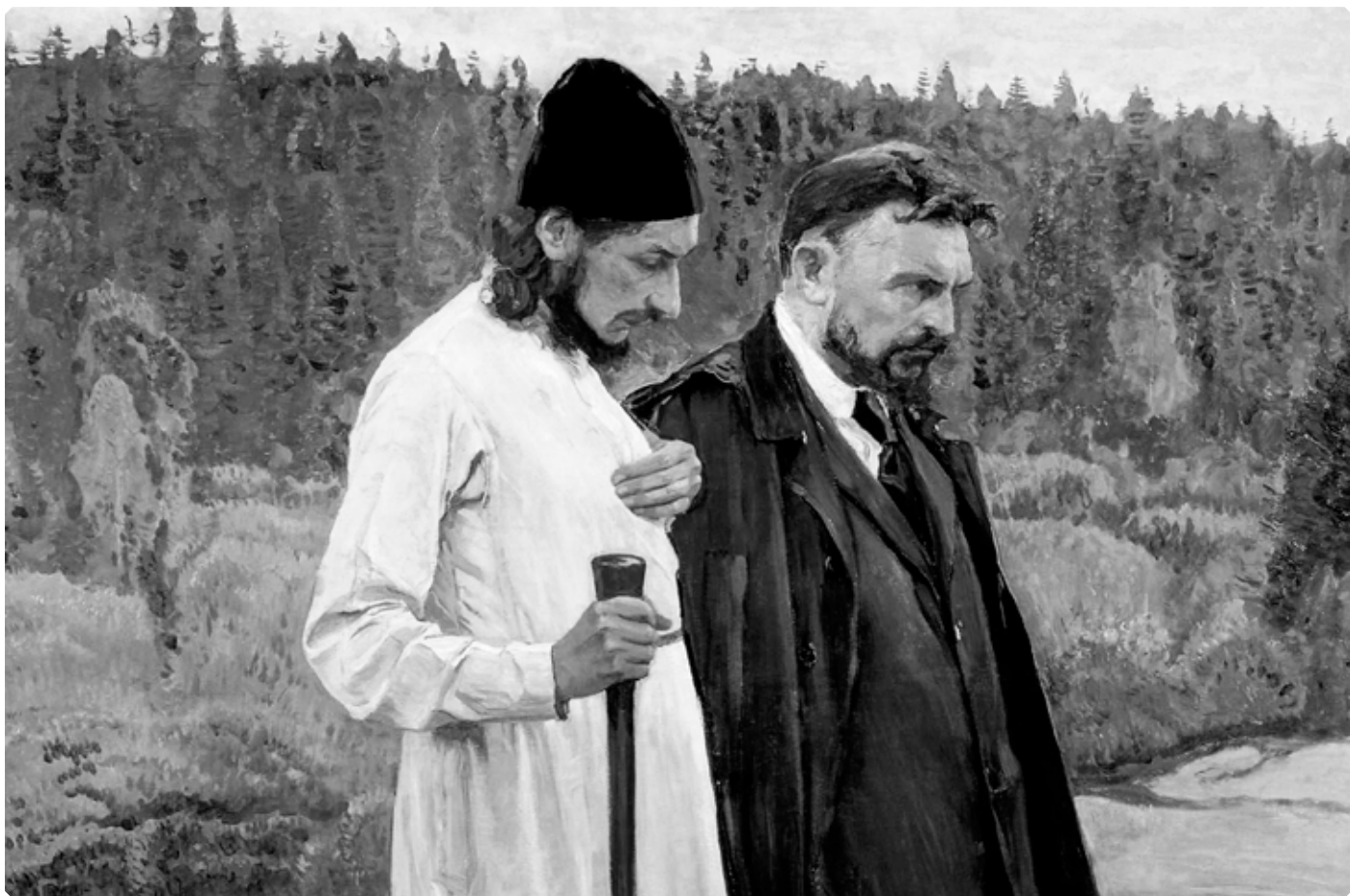
Михаил Васильевич Нестеров. Философы (С.Н. Булгаков и П.А. Флоренский). 1917 г. Холст, масло. Государственная Третьяковская галерея. Москва. Фрагмент.

Н.А. Некрасова, митрополит Симферопольский и Крымский Тихон (Шевкунов).