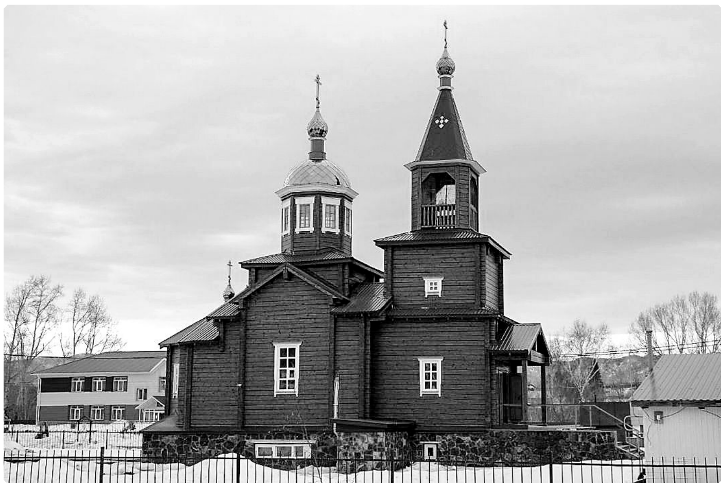
Современный храм Покрова Пресвятой Богородицы села Старобелокуриха. 22 марта 2020 г.