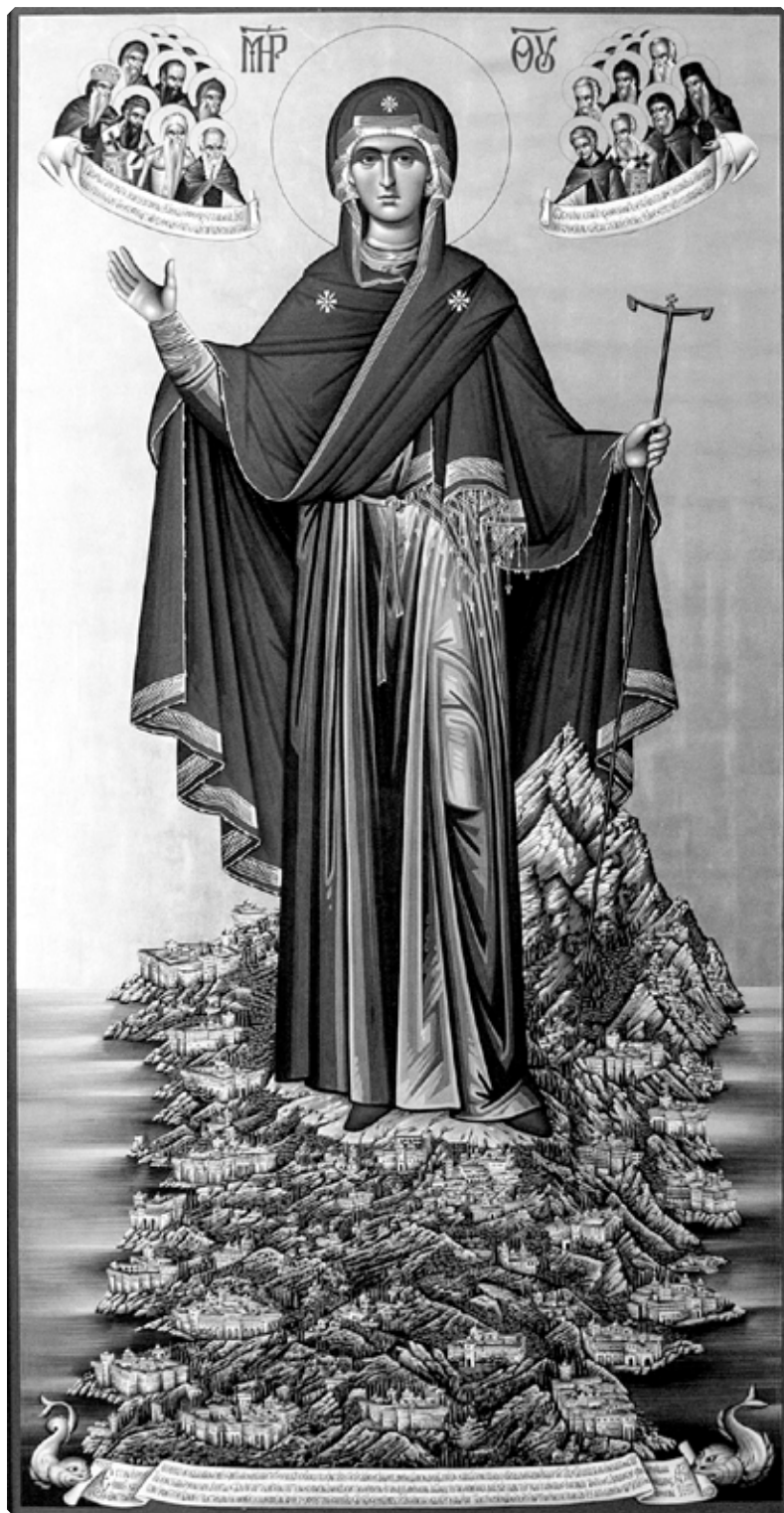
Икона Божией Матери «Игуменья Святой Горы Афонской». Середина XX в. Монастырь Хиландар на Афоне.

Всё необходимое для жизни земной будут иметь они, и не оскудеет к ним милость Сына Моего и Бога до конца веков. Этому месту Я буду Заступницей и буду просить о нем перед Богом».