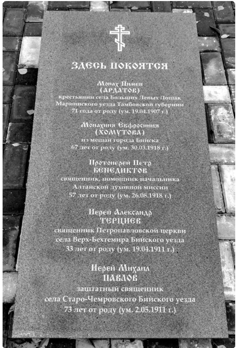
Плита мемориального комплекса на месте некрополя Казанской архиерейской церкви города Бийска. Октябрь 2023 г.