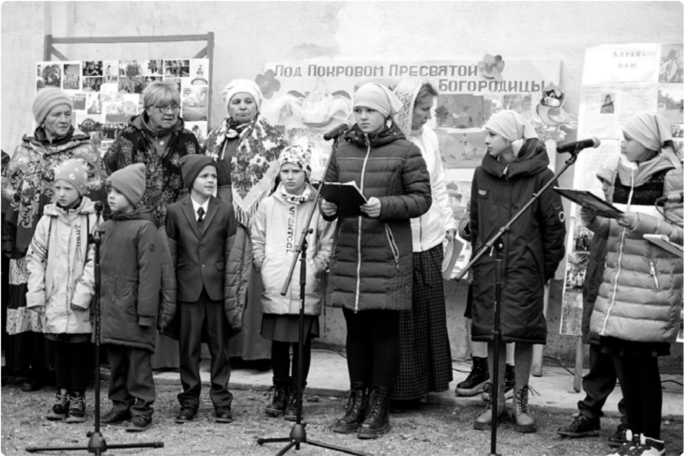
Праздничный концерт приходской воскресной школы «Радость моя». Свято-Макарьевская Покровская мужская монашеская община. 14 октября 2023 г.

Барнаульский и Алтайский, совершил чин малого освящения строящегося Покровского храма, и в пятницу Страстной седмицы в нём состоялось первое богослужение.