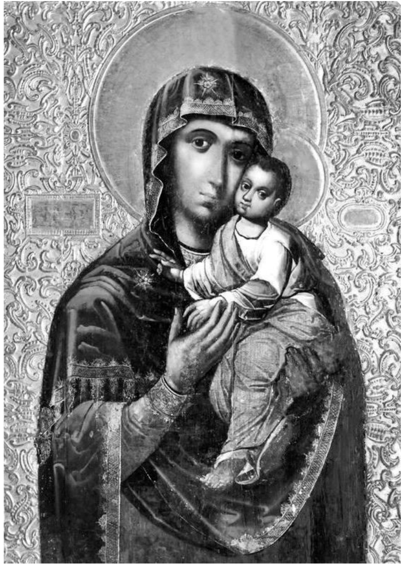
Киево-Братская икона Божией Матери. 1-я пол. – сер. XVIII в. Национальный художественный музей Украины, Киев.