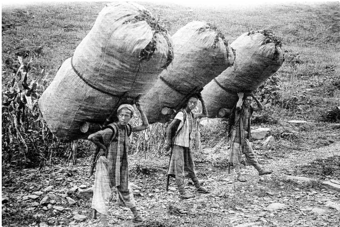
Носильщики чая. Китай, Кушань. 1917–1919 гг.

но и вообще обладают большей мускульной силой и могут больше совершить работы. “Известные своим воздержанием римские солдаты, – говорит “Science pour tous”, – носили такое тяжелое вооружение, которое, пожалуй, раздавило бы своей тяжестью самого здорового рабочего нашего времени, и он не смог бы сдвинуться в нём с места. Обратите внимание на смиренных носильщиков, которые питаются лишь несколькими плодами и оливками, и между тем поднимают такие огромные тяжести, которые совершенно не под силу нашим рабочим. Посмотрите на китайских кули ( рабочие-кули – наемные работники, которых в XVIII – начале XX вв. европейцы перевозили в качестве дешевой рабочей силы из Индии и Китая в колонии. – ред. ), которые питаются лишь горстью риса и почти никогда не знают усталости! Затем – трапписты ( монахи католического цистерцианского монашеского ордена. – ред. ), которые исполняют самые тяжелые работы, никогда вполне не отдыхают, соблюдают самые строгие посты и вне постов питаются лишь хлебом и вареными овощами, а между тем славятся своим необыкновенным долголетием. Строгое воздержание в пище и мускульный труд – вот, следовательно, главные условия здоровья и долгой жизни!»